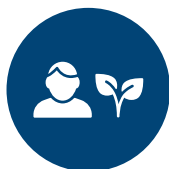
BÆREDYGTIG DRIFT OG ADMINISTRATION

Dette gøres ved at tilbyde certificeret grøn strøm til skibene, når de ligger i havn, og sikre lade infrastruktur til tung transport. Samtidig vil vi gå forrest for at inspirere og sikre en markant bæredygtig omstilling af den maritime sektor. Derfor arbejder Esbjerg Havn også med at kunne opbygge kompetencer og faciliteter nødvendige for at levere grønne brændstoffer til fremtidens skibe. Vi mener dette vil fremme havnens drift, havnen som energi klynge, maritimt erhvervs- område og som port til omverdenen