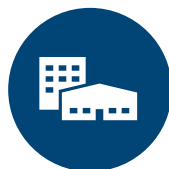
RAMMEN OM BÆREDYGTIG ERHVERVSUDVIKLING